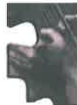
L'Evento negli anni scorsi