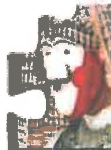
L'evento nel 2023