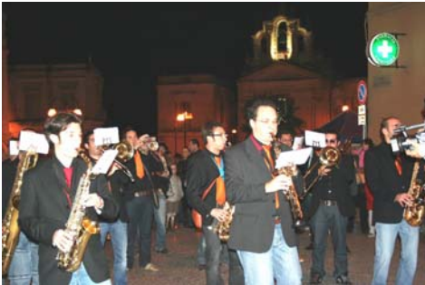
In Vino Veritas - Montescaglioso Immagini e manifesti delle passate edizioni.